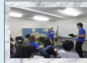
7月<高齢者の主な疾患>