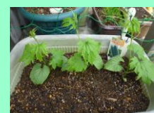
5月13日 ゴーヤの苗を 植えました☆