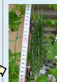
7月10日 20cm! 順調♪順調♪