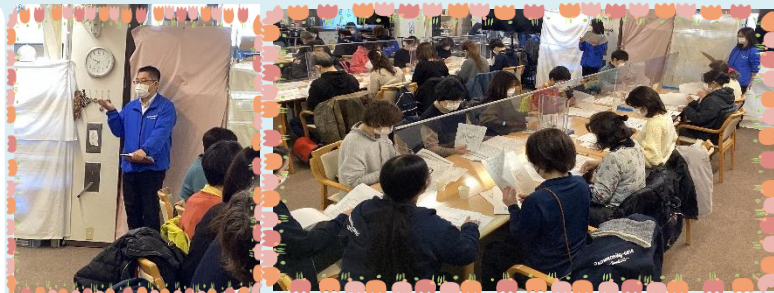
☆北楯社長のお話 ☆真剣に手元の資料に集中しています☆