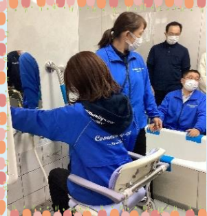
☆浴室での洗身介助☆